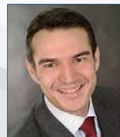
Stefan Waldeisen verlag moderne industrie GmbH